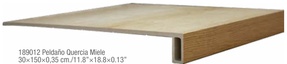
189012 Peldaño Quercia Miele 30×150×0,35 cm./11.8"×18.8×0.13"