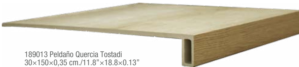
189013 Peldaño Quercia Tostadi 30×150×0,35 cm./11.8"×18.8×0.13"