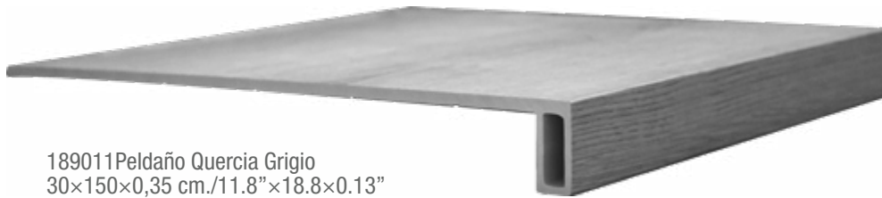
189011 Peldaño Quercia Grigio 30×150×0,35 cm./11.8"×18.8×0.13"