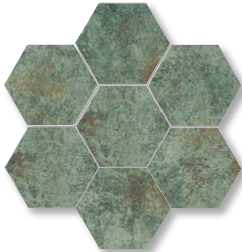
M609519 Hexa Velha Oxid