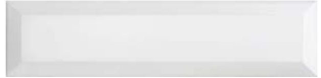
M608304 - MANHATAN BLANCO MATE