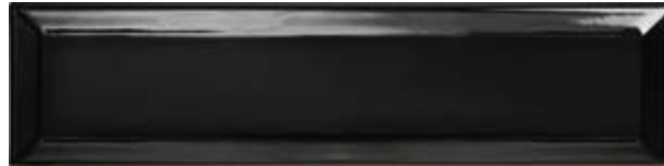
M608302 - MANHATAN BRILLO NEGRO