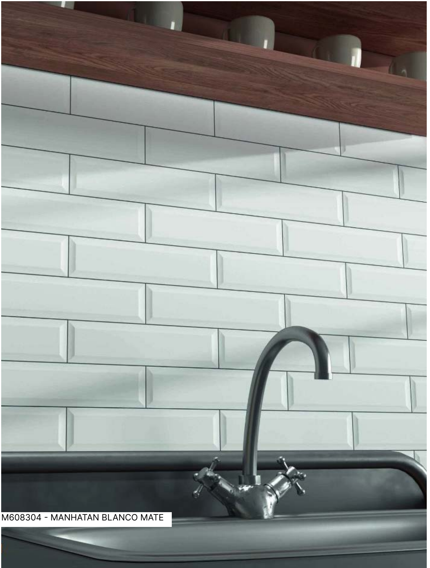
M608304 - MANHATAN BLANCO MATE